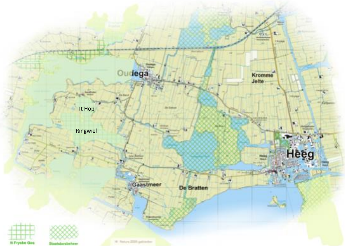
Figuur 1 Ligging plangebied Idzegea

Naast de watersport zijn ook de weidevogels een veel voorkomende gast. Binnen de Skriezekrite Idzegea (verbonden aan Collectief Súdwestkust) wordt al jaren gewerkt aan de instandhouding en het optimaliseren van het weidevogelbeheer. Mede daardoor is Idzegea al jaren een van de beste weidevogelgebieden in Fryslân en door de provincie ook als weidevogelkerngebied aangewezen. It Fryske Gea en Staatsbosbehear hebben in of nabij het plangebied enkele natuurgebieden in beheer en/of in eigendom (zie figuur 1 gearceerde gedeelten voor de ligging). Binnen het plangebied liggen de meertjes Ringwiél en It Hop die tevens de Natura 2000 status hebben en vallen onder Natuurnetwerk Nederland (NNN). De overige Natura2000 gebieden ten westen van It Hop en Ringwiél zijn tevens onderdeel van het NNN, maar vallen buiten het plangebied. De gebieden in beheer van Staatsbosbehear hebben geen Natura 2000 status, maar vormen wel een onderdeel van Natuurnetwerk Nederland (NNN) en een groot deel ervan ligt in het plangebied. Stichting Rijke Weide heeft sinds 2019 ca. 27 ha van de Grutte Polder, de Langehoek, Fiskersbuorren ten westen van Gaastmeer in eigendom. Ook dit deel valt onder Natuurnetwerk Nederland (NNN) en het plangebied.